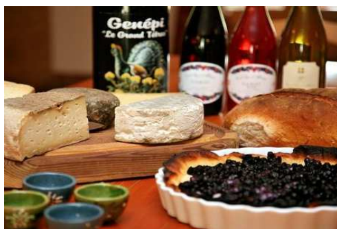
Gîte Panda Chalet du Lys