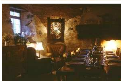
Gîte Panda Che Catrin